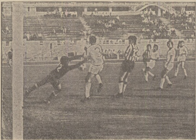
O fază din ultimul meci de campionat disputat de formația piteșteană.

barit cam mic, care însă a fost în mare compensat în campionatul trecut prin organizarea jocului și angajament. În noua ediție, F.C. Argeș va fi un adversar redutabil pentru că și tinerii au mai crescut... Angelo Niculescu avea o imagine proaspătă a echipei piteștene, adversară din ultima etapă a Sportului studențesc, la București, unde F.C. Argeș a pierdut la limită, dar a jucat foarte bine. „De Dobrin ce spuneți, tovarășe profesor?” — îl întrebăm pe fostul antrenor al naționalei. „Dobrin e o pleșă grea, el joacă din valoare! L-aș folosit vîr avansat, la nivelul ultimului fundaș. Lingă el, Radu II trebuie să mai