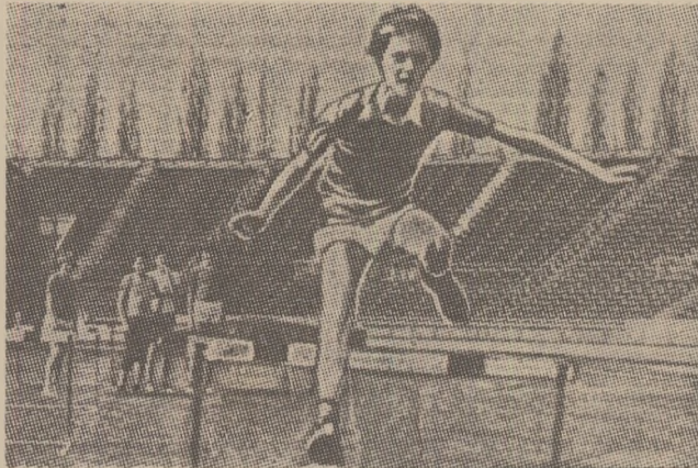
Elevii unei școli sportive din Varșovia la un antrenament de atletism, desfășurat pe modernul stadion din cartierul Ochocie

În întreaga țară funcționează astăzi aproape 100 de școli sportive, cu peste 12.000 de elevi, dar numărul tinerilor școlari antrenati în activitatea sportivă este mult mai mare. Se apreciază că din cele 8 milioane de elevi, aproximativ 800.000 fac sport în mod regulat, beneficiind de o bază materială modernă. Jumătate din cele 24.000 de școli ale Poloniei au un program largit de educație fizică, mergând până la 6 ore pe săptămână, conduse de profesori și antrenori cu înaltă calificare. Numai în școlile sportive, de exemplu, lucrează 233 de antrenori și 354 de profesori de educație