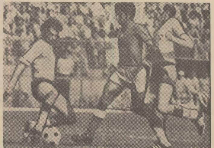
Timplaru (tricou de culoare închisă) produce emoții în careul advers. (Fază din meciul România - Suedia).

Victorie clară a formației române - 3-0 în fața Suediei - care putea fi realizată la o diferență de scor și mai mare dacă înaintașii n-ar fi ratat din poziții favorabile. Selecționata României a început bine partida, a inițiat atacuri periculoase și în min. 5 Vany a ratat un 11 m. Jucătorii români au dominat în continuare și