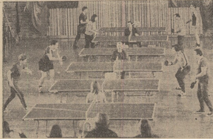
Îată o imagine din fazele preliminare ale Spartachiadei de tenis de masă