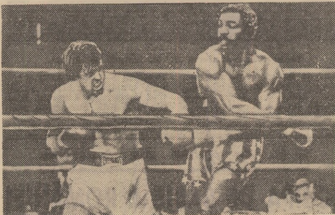
Scenă din finalul filmului „Rocky”

dolari și care fumează și bea bere cu măturătorii la barul din colț. Pe urmă — deus ex machina, în cea mai bună tradiție a filmului american de duzină — tînărului părăsit de bătrînul său antrenor (pentru că nu se ține serios de box), i se oferă dintr-o dată șansa vieții: să lupte pentru titlu cu campionul mondial, un fel de Cassius Clay, căruia în film i se spune, foarte sugestiv, Apollo Creed (deci, „crezul lui Apollo”, care se știe că a fost și frumos și zeul artelor). Pentru că scenariul e scris de chiar interpretul principal, Sylvester Stallone, credem că el și-a dat seama de pericolul unui happy-end ridicol, a înțeles că a fortat și așa hazardul prea mult, în consecință își propune, în marele meci, nu să-l învingă pe campionul mondial, ci doar să-i reziste 15 reprize, numai și numai pentru a dovedi, a-și dovedi că el e mai mult decît un „nimenea”, un neisprăvit, cum zice traducătorul filmului. Iar în ajutorul partidului, cînd i se topește curajul, Adrian, iubita, va fi cea care-l însuflă puteri. Alături de el e și bătrînul antrenor, vic-