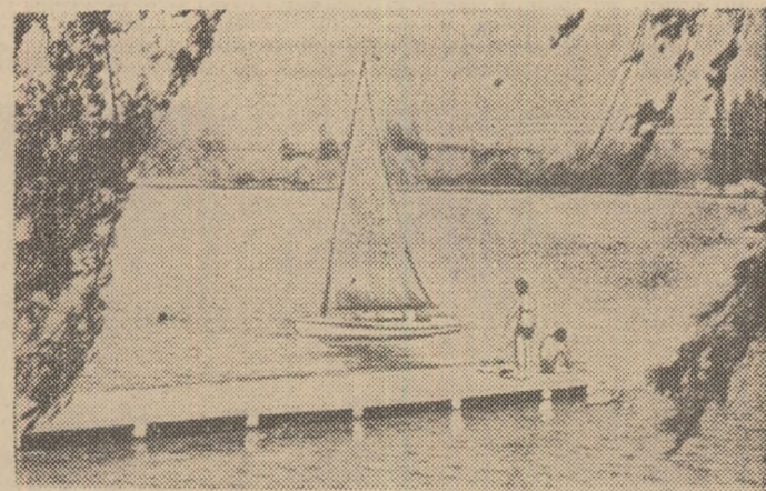
Sub adierea vîntului, o plimbare cu barca cu pinze devine extrem de plăcută