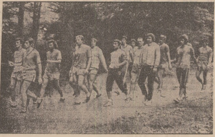
Jucătorii sătmăreni într-un moment al antrenamentului lor de la Poiana Brașov.

Olimpia Satu Mare a realizat, asemenea Petrolului, un excelent „parcurs de regularitate“ în Divizia B obținînd — cu destulă vreme înainte de atingerea „liniei de sosire“ — dreptul de a reveni în prima divizie. Sătmărenii au obținut, prin urmare, în minimum de timp, reintîlnirea cu cel mai important campionat al țării unde promovaseră în ediția 1975/76. Am reamintit acest lucru care îi becură, sîntem siguri, pe suporterii „galben-albaștrilor“ pentru că — revăzînd zilele trecute, la Poiana Brașov, actualul lot de jucători al Olimpiei — am constatat că aproape aceiași concurenți care făcuseră... pasul greșit al retrogradării au reușit foarte repede repararea acestuia și au readus formația lor printre concurențele din cursa Diviziei A. „...Tot cu marea majoritate dintre jucătorii care au făcut așa de repede la startul A-B-A ne prezentăm și la startul noii ediții de campionat, ne spunea antrenorul secund al Olimpiei, fostul fundaș de la U.T.A., Ștefan Czako. Sînt sportivi pe care îi cunoaștem foarte bine după un campionat destul de greu în Divizia B. Avem încredere în acești jucători și sîntem convinși că ei nu ne