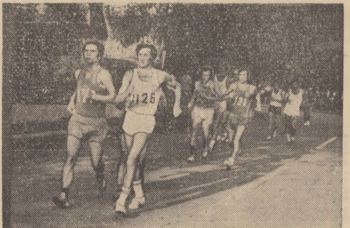
Aspect din timpul desfășurării cursei