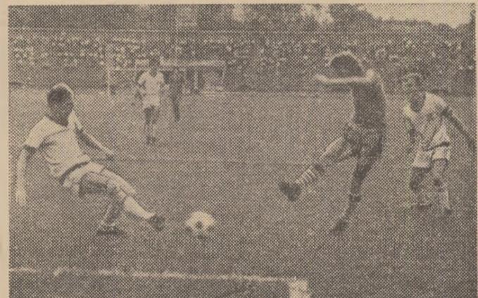
Apostol (Progresul) a șutat spre poartă, însă nu va fi gol (Fază din meciul Rapid — Progresul, disputat joi).

În deschidere, de la ora 15,30, Metalul și Progresul vor juca pentru locurile 3 și 4. Sperăm că și aceste formații vor realiza un spectacol agreabil, deoarece în partecile susținute joi au evoluat la un bun nivel. Reamintim prevederea regulamentară că, în caz de egalitate după 90 de minute, se vor executa lovituri de la 11 m.