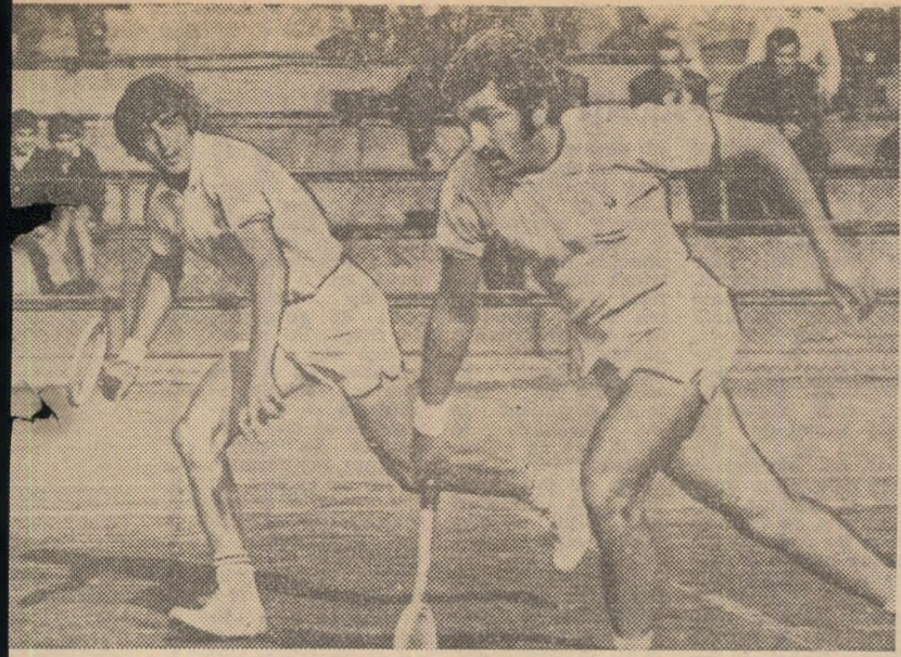
Ilie Năstase și Ion Țiriac, așa cum i-am văzut de atâtea ori de-a lungul anilor