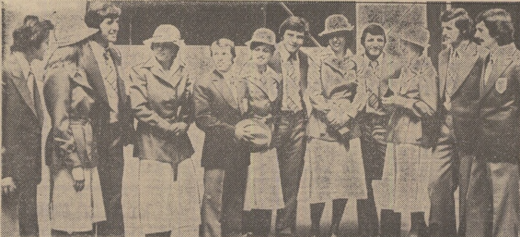
Un grup de studenți sportivi, care vor lua parte la Universiada '77

Așadar, studenții noștri sportivi pleacă astăzi la Sofia, hotărâți de a lupta cu toate forțele pentru o comportare cit mai frumoasă. Le dorim, tuturor, drum bun și mult succes!