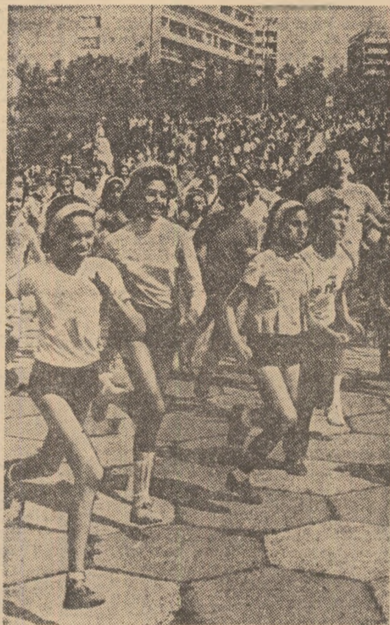
Alergările de cros constituie una din preferințele tinerilor în cadrul competițiilor desfășurate sub genericul „Daciadei”

Vă prezentăm în această pagină opinii și angajamente, din care se desprind deopotrivă satisfacția cu care a fost îmbrățișată marea competiție națională izvorâtă din inițiativa tovarășului NICOLAE CEAUȘESCU, secretarul general al partidului, precum și dorința unanimă de a-i asigura succesul deplin, prin traducerea în viață — cu simț de răspundere — a înaltelor idealuri care stau la temelia „Daciadei”.