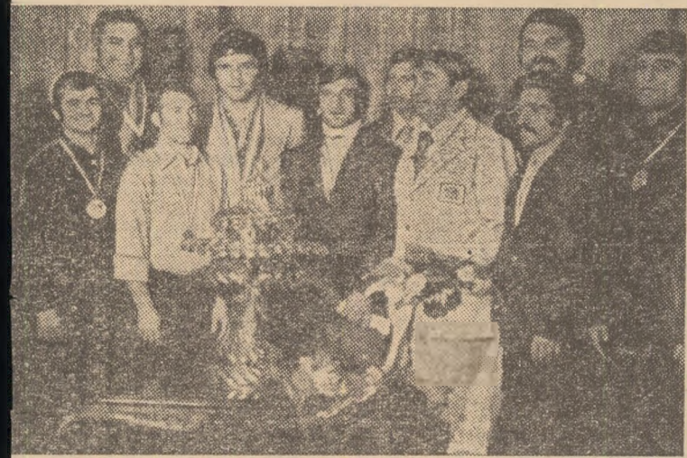
de la Bursa, luptătorii români au reușit un remarcabil succes de aur, 2 de argint și 2 de bronz

ntă și de Jocurile rostită, nostru, alte: din 1980, propu- să nim cele ate pen- mic, mult dome- u succes prețioase P.C.R. reputarea 1976-1980 leipării la u și im- ntu dez- de per-