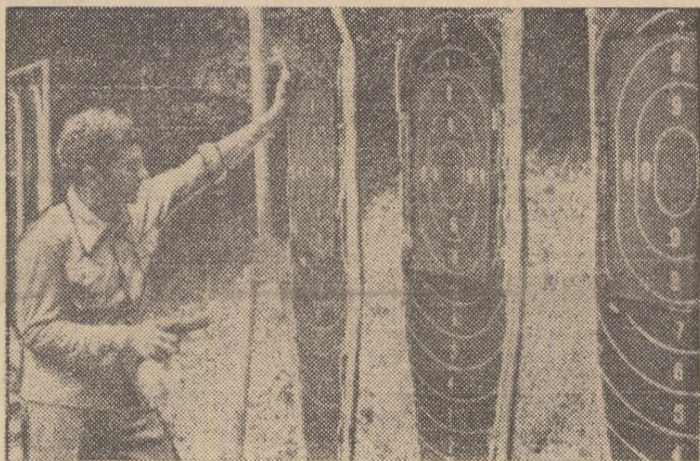
Intrat în febra întrecerilor, Virgil Atanasiu, component al echipei de pistol viteză, campioană europeană în 1975, își controlează ținta după o serie de controluri.