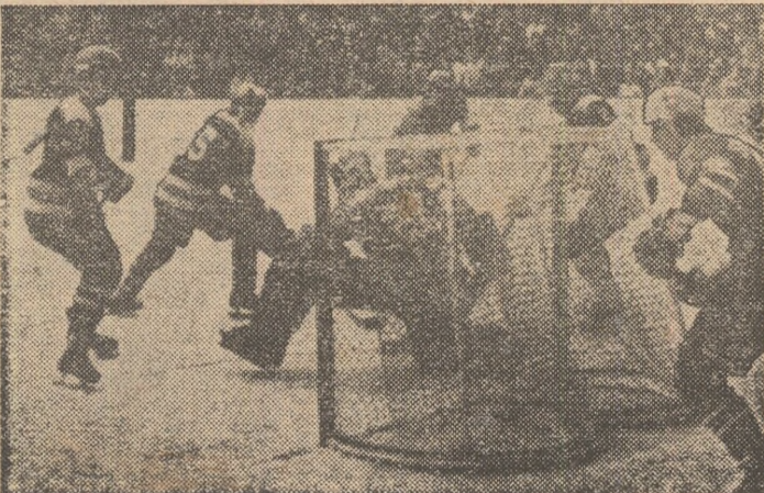
Hălăucă înscrie primul gol al echipei Steaua.

Cu excepția partidei Dinamo - Universitatea Craiova, celelalte jocuri încep la ora 16.