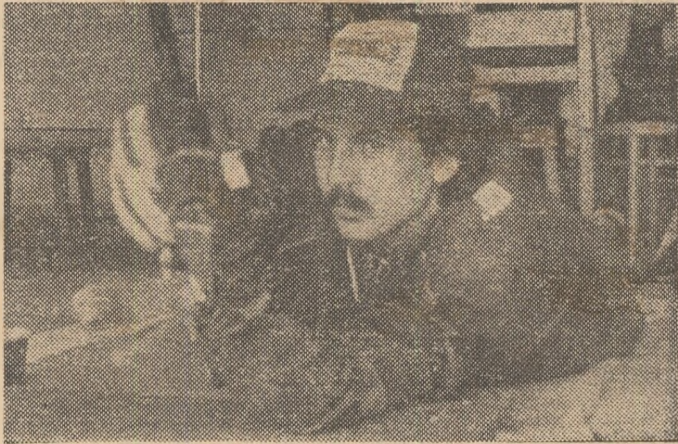
Un învingător neașteptat, dar merituos, la pușcă liberă 60 f c: polonezul W. Andrak.

Trăgătorii care au evoluat în probele de ieri, conform programului celei de a XIV-a ediții a Campionatelor Europene, au avut de înfruntat un adversar de temut: vântul puternic, în rafale, care și-a schimbat direcția ori de câte ori s-a nimerit. Foarte puțini dintre participanții la probele de pușcă liberă 60 f c și la prima manșă de la pistol viteză au reușit să se „strecoare”, executând cit mai multe focuri în perioadele de acalmie. Mulți dintre cei prezenți au spus că norocul i-a ajutat pe cei care s-au situat în fruntea clasamentului; există aici un dram de adevăr. Considerăm, însă, că au câștigat cei care au știut cel mai bine să evite „șicanele” naturii, cei care au muncit mult pentru fiecare foc în parte, trăgând rapid când vântul înceta și renunțând atunci când el începea să bată din nou. În aceste condiții dificile, învingătorul are mult mai multe merite, chiar dacă rezultatele, al său și în general, nu s-au ridicat la un nivel foarte înalt. Noul campion european la pușcă liberă 60 f c este polonezul Wiesław Andrak, un tânăr intrat de curând în atenția selecționarilor polonezi. Performanța sa: 596 p. Palmareșul său internațional nu este bogat. În schimb, pe locul al doilea s-a clasat un consacrat