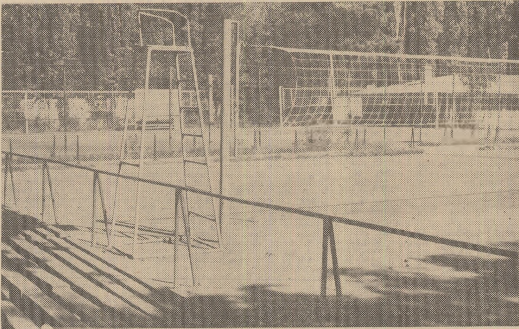
Aici ar fi trebuit să fie activitate, dar toate cele patru terenuri de volei erau (ca de obicei) PUSTII...