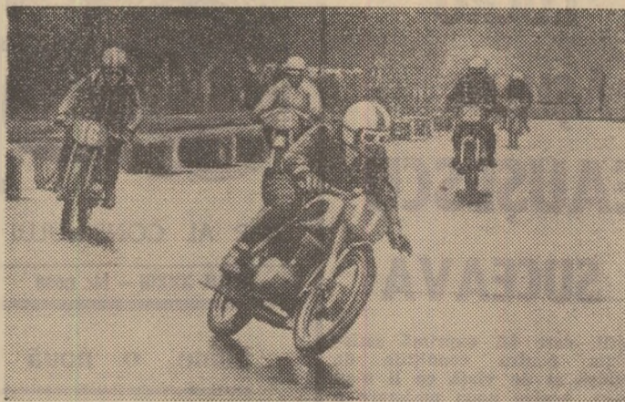
Viraj periculos în cursa motocicletelor din clasa 175 cmc

planoare cu calități tehnice superioare celor pe care au concurat sportivii noștri. Cum se explică, atunci, rezultatele bune obținute? În primul rând prin faptul că zburătorii noștri (ca și piloții de avioane și ca o parte din parașuțiști) au a-