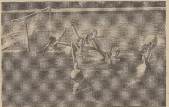
Vremea rece din ultimele zile nu-i împiedică pe viitorii poloști ai Rapidului să-și continue pregătirile în frumosul lor bazin cu apă caldă