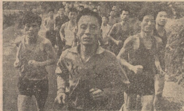
Întrecerile de masă sînt din ce în ce mai des și mai bine organizate în R.P. Chineză. Iată în imagine un aspect de la crosul popular ce s-a desfășurat cu participarea muncitorilor de la uzina constructoare de mașini din Hun Sian-cian

Lista marilor performanțe realizate în ultimii ani de trăgătorii chinezi este însă mult mai lungă și ea cuprinde și numele unor sportivi aparținînd diferitelor