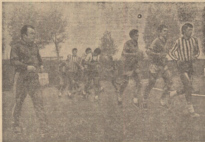
Juniorii „Oltului“ vor să salte anul acesta de pe locul doi pe primul loc în serie, cel care dă dreptul participării la finală.

„prezență“ din condică au rămas fără a-coperire pînă cînd ne-am încheiat vizita, adică pînă cînd directorul Nicolescu a luat măsura de a le tăia plimbăreților re-