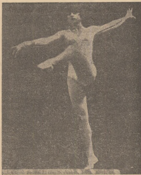
Nadia uimește din nou America...

NEW YORK, 10 (Agerpres). „O reușită manifestare sportivă, o excelență propagandă pentru gimnastică — acestea sînt aprecierile unanime ale presei americane de specialitate după demonstrația prezentată în celebra arenă Madison Square Garden din New York — considerată adesea loc al supremei consacării sportive — de către echipa feminină de gimnastică a României, care întreprinde un turneu în S.U.A. După intonarea imnurilor de stat ale celor două țări, „cea mai bună gimnastă a tuturor timpurilor“ — cum o denumește presa de aici pe Nadia Comăneci — a oferit, împreună cu coechipierele sale, un adevărat recital de virtuozitate sportivă, dovedind din nou înalta clasă a gimnasticii românești. În stilul său specific, cu farmecul ei deosebit, Nadia Comăneci, care a mai concurat în această sală în 1976, cînd a cîștigat prima ediție a Cupei Americii la gimnastică, organizată cu prilejul bicentenarului S.U.A., a impresionat din nou zecile de mii de spectatori, ce ocupau pînă la aproape ultimul loc din uriașă sală (New York Times). Evoluind cu o siguranță perfectă la birnă, aparatul la care a obținut nota maximă și la Montreal și apoi la Praga, săriturile sale în dificilul stil