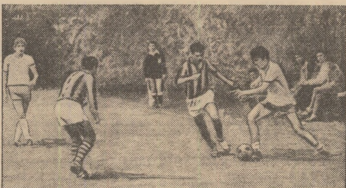
Toată atenția juniorilor, schimbul de mîine al fotbalului nostru ! În imagine, fază din meciul Dinamo — C.S. Tirgoviște