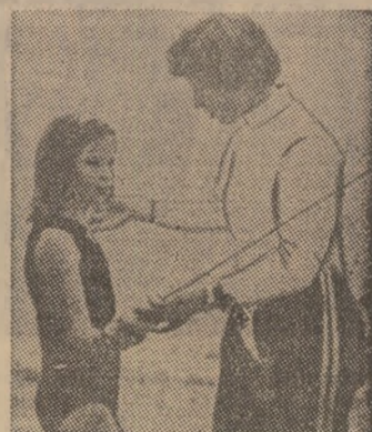
Profesoara (Rejto Ildiko, fostă campioană olimpică și mondială la scrimă) și eleva, la un antrenament al secției de copii a clubului Ujpesti Dozsa

„Începînd din acest an, activitatea în sportul școlar se desfășoară după o concepție nouă, menită să contribuie la dezvoltarea și întărirea bazei sportive de performanță din țara noastră” — ne-a declarat, într-o convorbire purtată recent la Budapesta, Nagy Tamás, șeful Secției educație sportivă din cadrul Ministerului Educației din R.P. Ungară. Cîteva mășuri concrete ilustrează elocvent afirmația. Așa, de pildă, în clasele a II-a și a III-a învățarea înolțării a devenit obligatorie, la absolvirea clasei a III-a elevii trebuind să cunoască două procedee: craul și spate; în gimnaziile (clasele IX—XII) toate școlile au săli de sport, iar profesorii de educație fizică sînt selecționați dintre cei mai buni; colaborarea cu marile cluburi sportive a devenit mult mai strînsă.