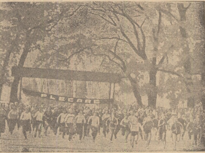
În parcul Vedeia din Alexandria, s-au întrecut concurenții la cros și la popice, în cadrul finalelor primei ediții a „Festivalului sportului muncitoresc de masă”. În imagine, startul fetelor în „Crosul ucenicului”

ne, indiferent de rezultat, promovarea în etapa superioară. Aceste ultime două prevederi regulamentare au stîrnit unele discuții, în sensul că, prin ele, s-ar putea înlesni unora anumite situații favorabile, iar pentru alții — dimpotrivă. Noi, însă, am reținut aspectul esențial al problemei controversate, anume acela că, în fond, respectivele discuții reflectă interesul sincer pentru acțiune, a testînd implicit caracterul deloc formal al „Festivalului”.