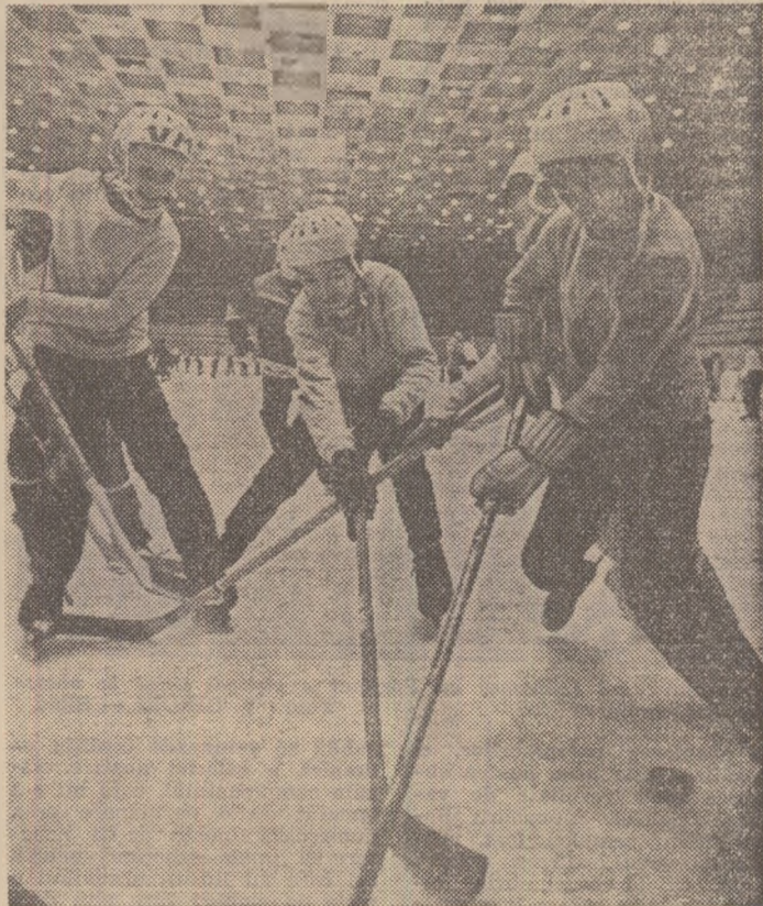
Viitori maeștri ai hocheiului sovietic...