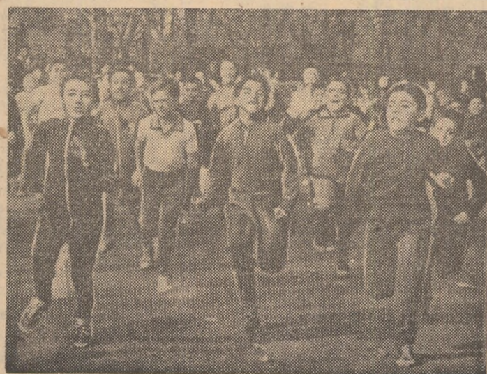
Cînd copiii sprintează cu ailită vigoare la 8-9 ani, e împedat că în acest elan se află ceva din sufletul învățătorului...