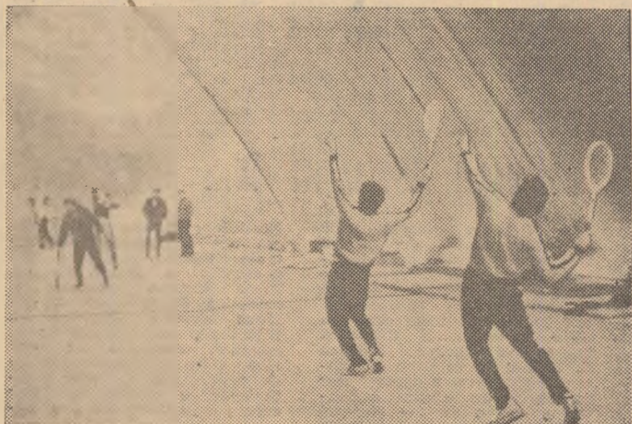
În plin efort, pentru perfecționarea loviturii de serviciu

Pregătirea „schimbului de miine”, problemă vitală