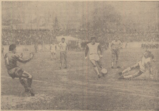
Omniprezent, Sătmărcanu II înscrie golul victoriei dinamoviste