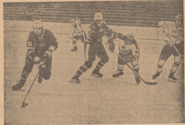
Hocheiștii cehoslovaci sînt în posesia pucului, în această fază a meciului de ieri.

● Echipa Șahilor Donețk a jucat la San Jose cu formația Cartago Sport, pe care a invins-o cu 2-1 (1-0).