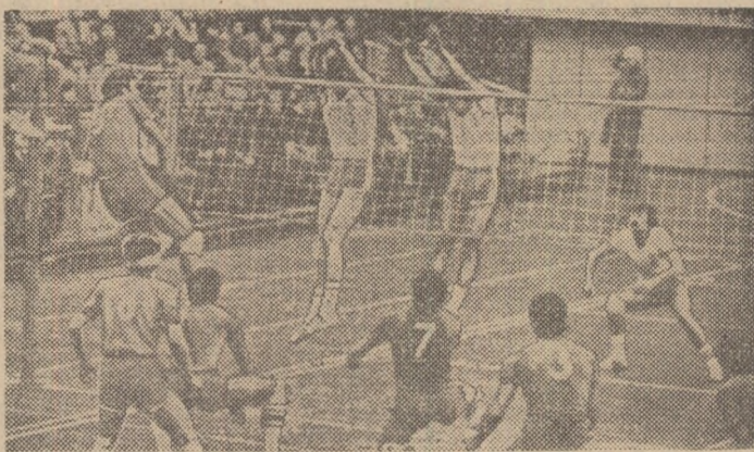
Blocajul dinamovist a fost depășit și Steaua realizează un nou și prețios punct

Un numeros public a urmărit aseară, în sala Floreasca, partida derby dintre echipele masculine Dinamo și Steaua, din cadrul turului Diviziei A de volei. Așa cum anticipam, jocul a fost de mare tensiune — și în teren și în tribune —, de luptă antrenantă. Dar, din păcate, aceasta nu a avut nici o legătură cu calitatea jocului practicat de cele două echipe, care nu s-au situat la înălțime, așa cum trebuie să se prezinte două formații fruntașe ale voleiului nostru, în care evoluează întreg lotul reprezentativ. Atractivitatea derby-ului a constat în palpitanta evoluție a scorului și în câteva faze mai reușite în anumite momente ale partidei, în special în finalurile de set. În rest, s-a greșit cît pentru trei meciuri, începînd de la execuția serviciului și preluare și terminînd cu atacul (stereotip și nesigur) și apărarea în linia a doua. Dinamo a prezentat un sextet mai bine pus