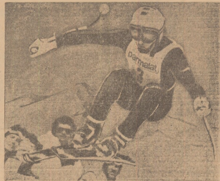
Franz Klammer, învingător în concursul de la Montana Crans, surprins într-o poziție acrobatică în cursa pe care a câștigat-o.

cundă a U.R.S.S. a întrecut echipa R.D. Germane cu 30-22 (17-10).