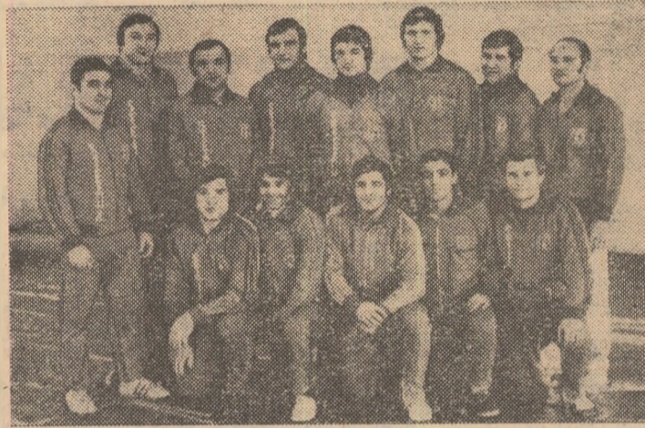
Cu satisfacția de a fi cucerit un nou titlu, luptătorii echipei Steaua au acceptat invitația de a face o fotografie de grup...

● O săptămână mai târziu, aceeași piscină va fi gazda unui alt concurs internațional deschis sportivilor de toate