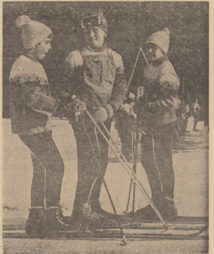
Sfatul celui mai mare...

(cu concursul corespondenților noștri Telemac SIRIOPOL — Galați și Ilie IONESCU — Sibiu)