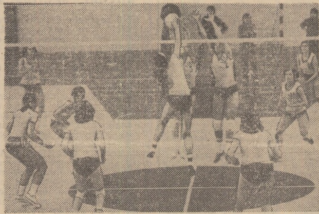
Ieri s-au disputat cîteva partide restante din cadrul campionatelor de volei. În Capitală a avut loc întîlnirea feminină I.E.F.S. — Universitatea Timișoara, de la care fotoreporterul nostru Ion Mihăică vă prezintă această imagine. Citiți în pagina a 4-a rezultatele și unele amănunte de la aceste partide.