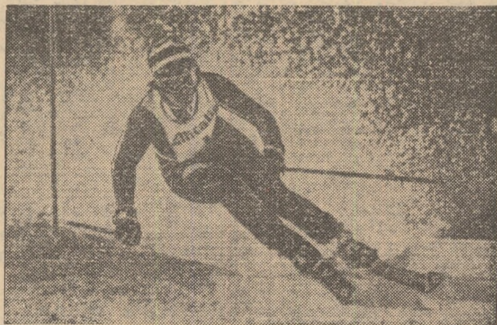
Schioara Hanni Wenzel (Liechtenstein), una din fruntașele actualei ediții a „Cupelor Mondiale“