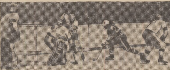
O nouă șarjă a hocheiștilor noștri (echipament de culoare închisă) la poarta excelentului J. Wojtynek.