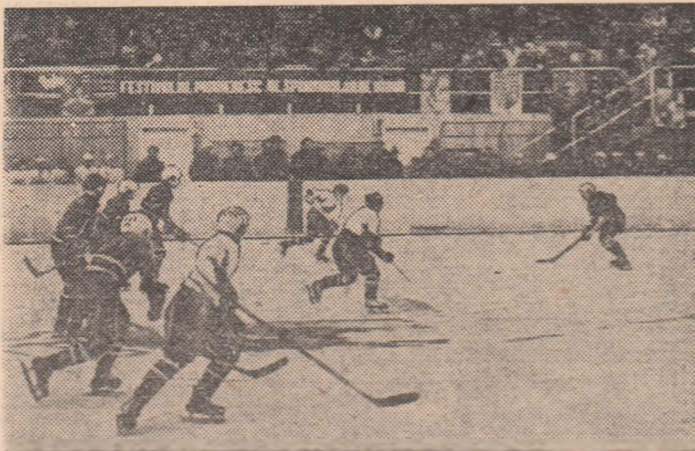
După festivitatea de deschidere a festivalului, pe „scena“ de gheață a patinoarului artificial din Miercurea Ciuc și-au disputat inițiativa două formații de pionieri din localitate

Este ușor de înțeles acum că pionierii veniți din atâtea județe ale țării nu au fost invitați la întâmplare, că ei au fost selecționați dintre cei care învăț bine și se dovedesc pricepuți la hochei pe gheață, patinaj, schi și săniș. În cadrul planului general întocmit pentru vacanța de iarnă, Consiliul Național al Organizației Pionierilor, C.N.E.F.S. și federațiile de resort au inițiat, sub genericul „Daciadei“, prima ediție a „Festivalului pionieresc al sporturilor de iarnă“, minunat prilej de refacere fizică și psihică după un trimestru de învățtură, de cunoaștere a frumuseților cu care natura și anii socialismului au înzestrat această parte a țării, a oamenilor care trăiesc și muncesc aici, de a lega prietenii trainice, de a