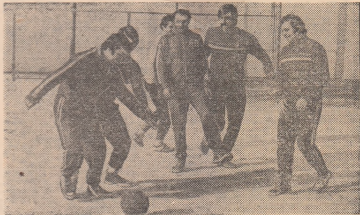
Fotbalul — sport complementar pentru poloștii — este practicat și în zilele friguroase de componenții echipei campioane, Rapid

— Se antrenează. În fiecare zi îi găsiți la bazinul Floreasca, unde efectuează antrenamente pentru îmbunătățirea rezistenței