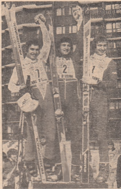
Trei și ei coborâri. Herbert Plank, Franz Klammer și Joseph Walcher.

trecut. Campioana și recordmana țării noastre Carmen Bunaciu ocupă locul 7 în proba de 200 m spate, cu timpul de 2:17,89 și locul 10 la 100 m spate, cu 1:05,20.