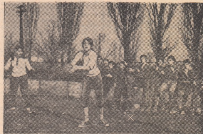
Chiar dacă temperatura a coborît „sub zero”