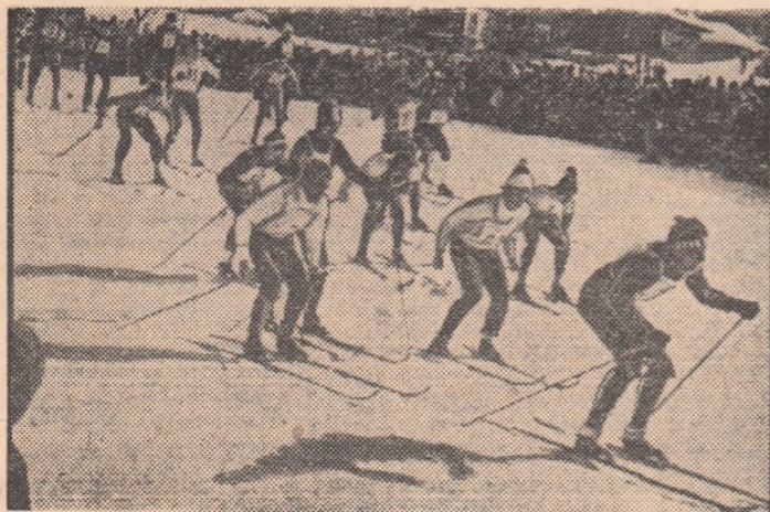
Start la Vatra Dornei