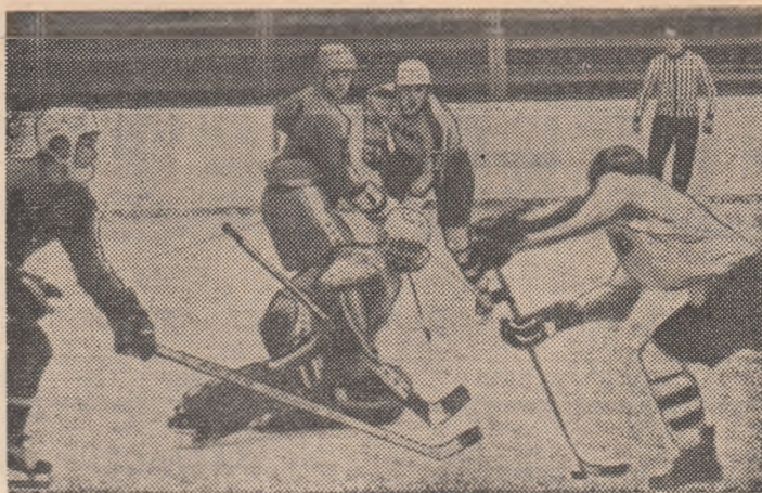
Una din numeroasele acțiuni ofensive ale echipei române drămasă, din păcate, fără rezultat

Dornici să se revanșeze, și luînd jocul în serios, juniorii noștri au făcut o partidă excelentă, în care au dominat marea majoritate a timpului, reușind combinații de toată