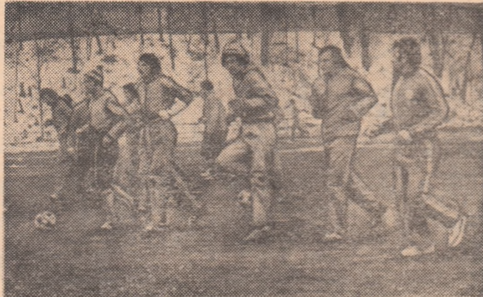
Secvență de la antrenamentul de ieri al echipei Dinamo