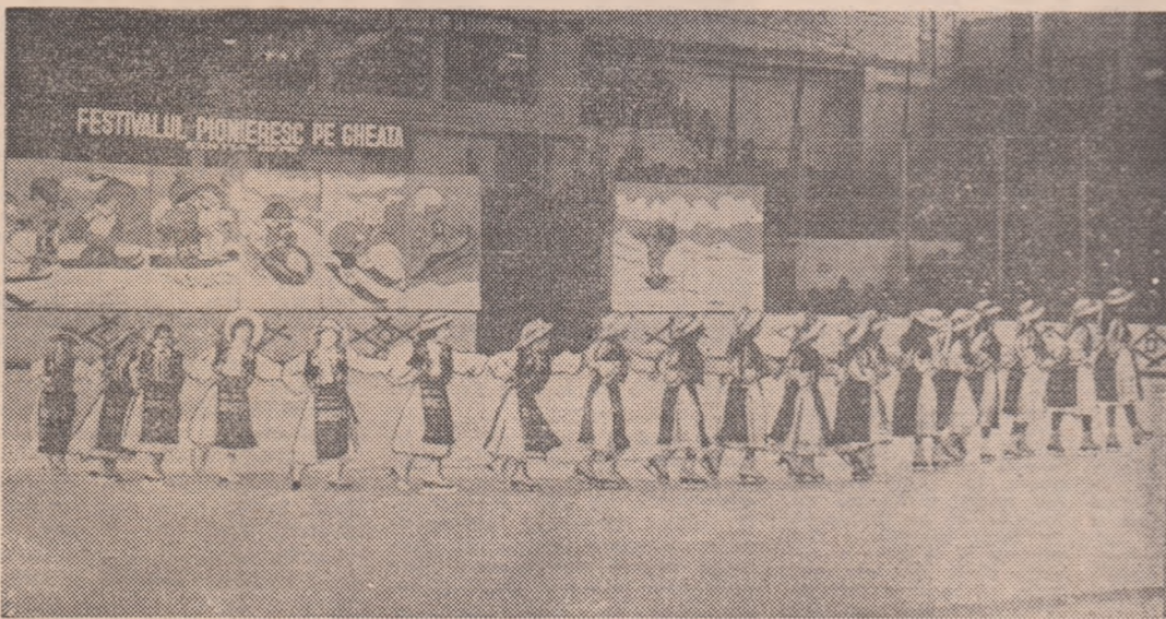
„Dansul fetelor de la Căpîlna”, pe luciul gheții patinoarului „23 August” din Capitală.

Duminică dimineața, un pui de pinguin s-a rătăcit pe gheața patinoarului „23 August”. Il căutau frații lui, dansînd pe patine, îl căuta „ingrijorata mamă” și toate tribunele, pline cu pionieri și elevi, au izbucnit în aplauze cînd, în sfîrșit, Fram, ursul polar a reușit să-l găsească. Dar pînă a-l găsi, bătrînul și greoiul urs a căzut de cîteva ori, odată a făcut chiar trei tumbe la rînd, spre hazul întregii asistențe. A fost unul din numeroasele tablouri susținute de micii patinatori bucureșteni la „Festivalul pionieresc pe gheață” - ediția 1978, organizat în cadrul „Daciadei”, de Consiliul Național al Organizației Pionierilor, împreună cu C.N.E.F.S. și M.E.I.