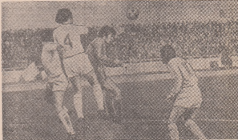
Radu II - în luptă cu trei jucători hunedoreni. Moment din partida de la Pitești.