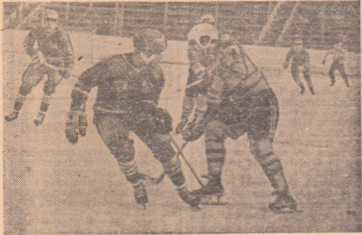
Atac al hocheiștilor noștri respins de apărarea echipei R. P. Chineze

Selecționata de hochei a R. P. Chineze și-a încheiat turneul întreprins în țara noastră, ultima verificare înaintea participării sale la întrecerile grupei C a campionatului mondial. Ieri seară, la „23 August”, echipa R. P. Chineze a întrecut o selecționată a țării noastre, cu scorul de 6-2 (2-0, 2-1, 2-1), luându-și astfel revanșa după înfringerea suferită sâmbătă, cu 7-3.