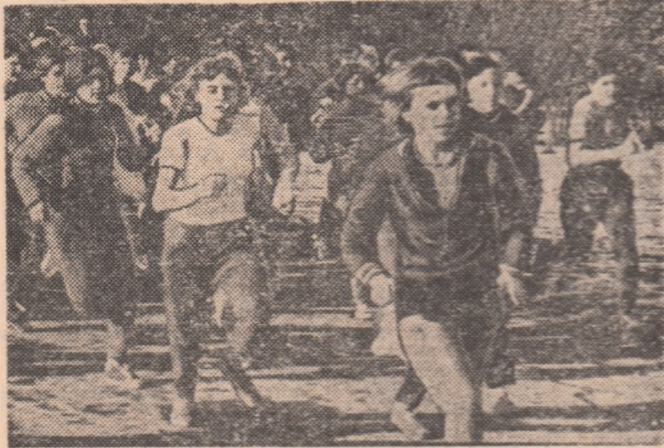
„Daciada” trece masiv în... aer liber. Între competițiile care se bucură de popularitate se numără crosurile...

Organizată din inițiativa secretarului general al partidului, tovarășul NICOLAE CEAUȘESCU, marca competiție sportivă națională „DACIADA” va intra, începând de duminică 19 martie, într-o nouă etapă: ediția de vară. După frumosul succes de care s-a bucurat ediția de iarnă, în cadrul căreia au fost angrenați — de la etapele de masă și până la cele 10 finale pe țară — sute de mii de tineri și tinere din școli, întreprinderi și instituții, de la orașe și din mediul rural, este de așteptat ca startul întrecerilor în aer liber — în care există, practic, posibilitatea cuprinderii întregului tineret, la cât mai multe discipline — să constituie un eveniment cu ample rezonanțe. Întrecerile vor începe, după cum prevede regulamentul „Daciadei”, cu etapa pe unitățile de bază: atelier, secție, sector, clasă, an de studiu etc. Se impune folosirea acestui prilej și pentru or-