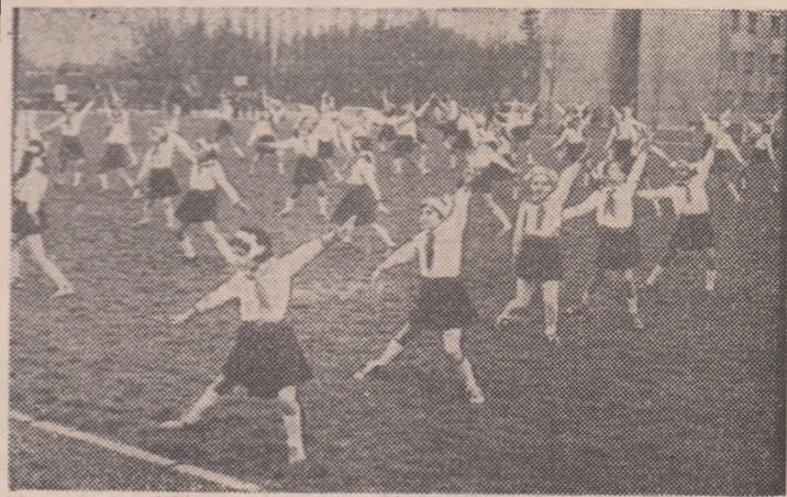
Pionieri din sectorul 6 al Capitalei executînd o repriză de gimnastică la baza sportivă Sălaj-Vicina