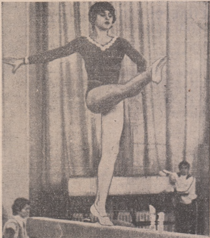
Concursul de verificare a gimnastelor frunțase