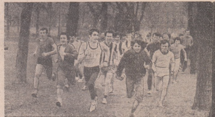
Printre copacii Stadionului Tineretului tineri elevi și muncitori din sectorul 1 în întrecere cu ei înșiși și cu... vremea.

A bătu vîntul, a plouat ieri dimineața în Parcul Tineretu-