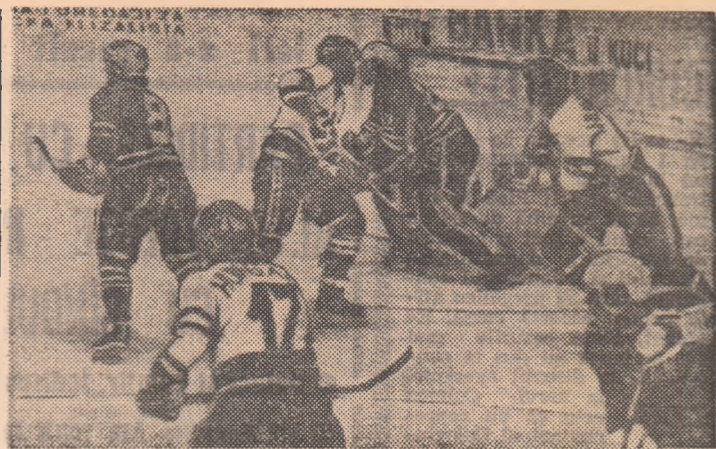
În partida cu echipa Ungariei, reprezentativa României a obținut o categorică victorie, 8-0. În imagine: jucătorul nostru Antal (8) pleacă în urmărirea pucului.