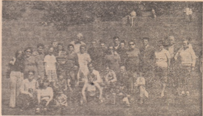
Imagine de album: un grup de „vulcaniști” în excursie la Izvorul Mureșului