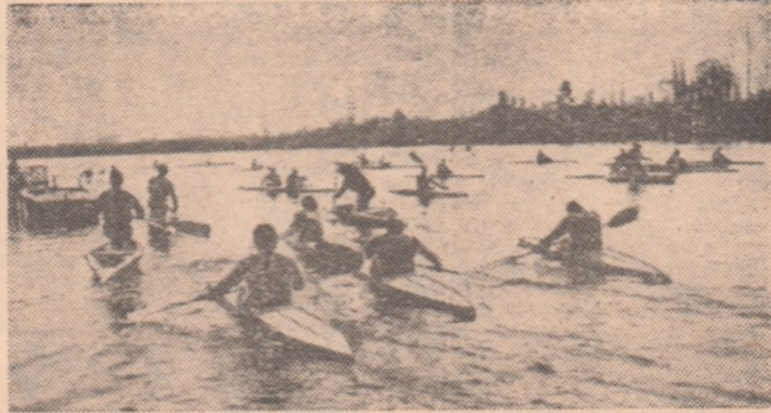
Caiacele și canoele au luat din nou în stăpînire apele Snagovului

Caiacele și canoele au ieșit pe apă! Flotila campionilor padelei și pagaii s-a întors în „oaza” de la Snagov, locul unde s-au plămădit atîtea și-atîtea medalii de aur — olimpice, mondiale, europene... Bătrînul lac i-a primit puțin umflat — la propriu! —, parcă supărat de îndelunga așteptare, gata să iasă din matcă la cea mai mică undă.