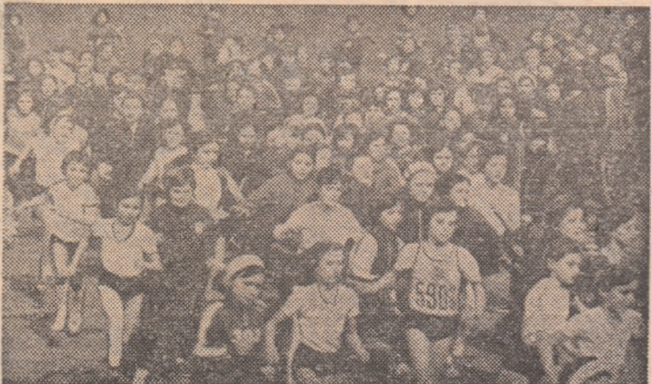
Întrecere viz disputată între micile concurențe, la una din probele de cros desfășurate pe Stadionul tineretului din Capitală.