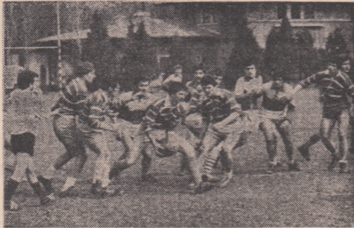
Aspect de la întâlnirea de rugby dintre echipele de juniori de la Olimpia și Rapid, desfășurată pe Stadionul tineretului din Capitală

La redacție ne sosește cu regularitate programul competițional alcătuit de C.M.E.F.S. București pe baza informărilor primite de la consiliile de sector. Așa a fost și săptămâna trecută, fapt care ne-a dat posibilitatea să aflăm în detaliu ce manifestări sunt programate în cadrul competiției naționale „Dacia” pe bazele sportive ale Capitalei.