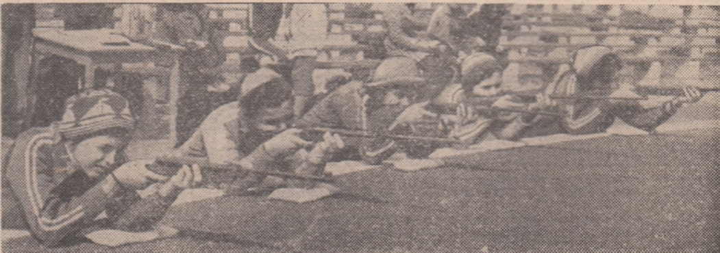
Aspect de la concursul de tir al fetelor