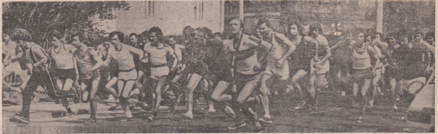
Un mare număr de tineri au participat la fazele de masă ale „Crosului tineretului“, care i-au desemnat pe finaliștii ce se vor înfățișa la finala pe țară din ziua de 2 mai. În imagine, aspect de la faza județeană organizată la Iași.