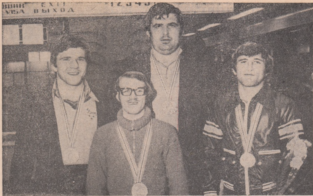
Cei patru campioni europeni la sosirea pe aeroportul Otopeni.