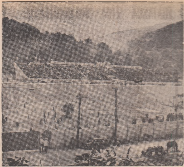
Stadionul „Cimentul” din Fieni

REȘIȚA. Numeroși oameni ai muncii din „cetatea focului nestins” a Reșitei își vor îndrepta pașii, în zilele care urmează, spre bazele de agrement. Pe lângă petrecerea timpului liber în mod plăcut, în aer liber, ei vor avea prilejul să asiste la o seamă de demonstrații sportive organizate acolo. Astfel, la baza de agrement Secu, pe podiumul special amenajat, se vor face demonstrații de box și lupte cu participarea sportivilor de performanță din Reșița, se vor organiza întreceri de volei și minifotbal. La Complexul Crivaia, în apropierea frumosului lac de acumulare de la Văliug, au fost amenajate trei noi terenuri de sport bituminizate — handbal, volei, tenis de cimp — care vor sta începînd din aceste zile la dispoziția oamenilor muncii veniți la odihnă.