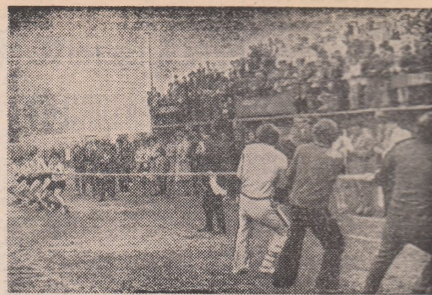
Zi de sport, de „Daciada”, pe terenurile frumoasei așezări bihorene Suplacu de Barcău. Sub genericul mării competiții sportive naționale tot mai mulți tineri și vîrstnici își dispută înțietatea, la sfîrșit de săptămîină, în diferite entuziaste întreceri. În imagine: o repriză animată la „trasul frîngiei”