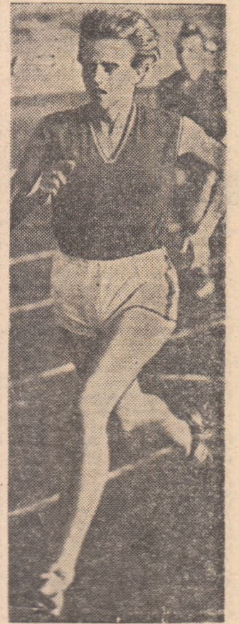
Campioana europeană de sălă Heana Silai se va alina și ea la primul start al sezonului athletic în aer liber

Prevederea se adresează, desigur, atleților frunțași. Cei mai mulți dintre ei vor putea fi văzuți astăzi și miine pe Stadionul Republicii din București, care va găzdui întrecerile primei etape a grupeii frunțașe. Va fi interesantă lupta dintre echipele cluburilor Steaua, Dinamo, C.A.U., Metalul, Rapid sau ale județelor Argeș, Cluj, Constanța și Iași pentru un loc conform aspirațiilor și posibilităților acestora, dar mai interesantă va fi, neîndoios, tentativa celor mai buni com-