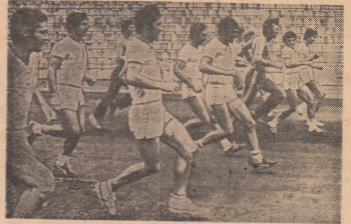
La comanda antrenorului Oprea Vlase, dinamoviștii efectuează sprint după sprint. Să fie oare un mijloc de pregătire a contratacului?