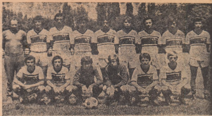
După C.F.R. și Ripensia, această echipă a Politehnicii a cîștigat al 3-lea titlu de campioană la juniori pentru Timișoara

● „VREM SĂ ANIVERSĂM UN JUBILEU CU TROFEUL IN VITRINA CLUBULUI”, aceasta este marea dorință a argeșenilor, care vor sărbători, în această vară, 30 de ani de existență a clubului. După jocul cu U.T.A., pînă seara tirziu, suptorii au cîntat pe străzile orașului bucuria obținerii locului II în campionat și bineînțeles că și-au adaptat repertoriul și la semifinla de miine, de la Sibiu. „Argeș dacă ne lubești, adu Cupa la Pitești”, iată refrenul galeriei „alb-violeților”, repetat de zeci de sute de ori în fața sediului clubului. Antrenorii F. Halagian și A. Dima mențin formația în „block-starturi” pentru ca elevii lor să poată zbura în teren ca în ultima parte a jocului cu U.T.A. O singură incertitudine: Doru Nicolae, ușor accidentat joi.