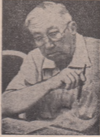
R. W. JONES

R. Busnel (63 ani), „figura cea mai marcantă a baschetului francez” — cum îl numesc enciclopediile sportive — mult timp director tehnic al echipei Franței și cunoscut teoretician, ne-a spus: „Baschetul european — pe care-l cunosc mai bine — marchează de cîteva ani o substanțială creștere cantitativă, dar, din păcate, și o scădere pe planul calității. Masa de jucători (și mai ales de jucătoare) nu mai ajunge în clasă pe cel marl. Printre cauze: ne lipsesc echipele de juniori și avem prea mulți antrenori de grad superior, în așa fel încît nu mai are cine să se ocupe de chestiunile „mărunte”, de pildă de tehnică... „Gigantismul” e o falsă problemă. În 1973, cînd am făcut, la Barcelona, experiența cu un campionat mondial rezervat jucătorilor de peste 1,80 m, a ieșit un