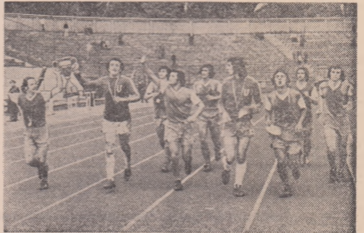
Jucătorii Universității Craiova, la puține momente după ce au intrat în posesia celei de a doua cupe, își savorează succesul

„Calculule hirtiei”, nu prea agregate de... cupă, care le contrazice adeseori, au fost respectate ieri: Universitatea Craiova, favorita finalei, a învins pe Olimpia Satu Mare, merituosă sa parteneră de întrecere, cu 3-1 (2-0). N-a fost o finală care să rămînă, cum se spune, de neuitat... Chiar dacă nu ne ducem cu amintirile prea departe decît acum un an, la cea disputată dintre formația craioveană și Steaua, și avem repede o comparație în fața căreia jocul de ieri nu are — sub raport calitativ — cîștig de cau-