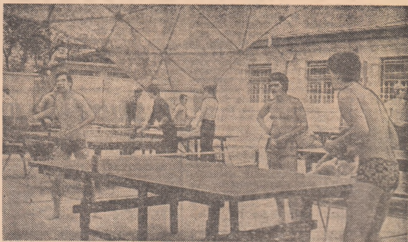
Tenis de masă sub noua copertină: acum un an, aici era o peluză de iarbă... Încă un punct de atracție pentru vizitatorii „Teiului studențesc“