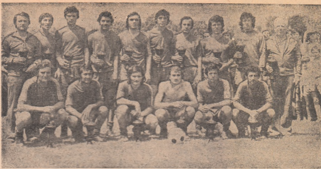
F.C. Gloria după ultimul meci din Divizia B (cu Tractorul Brașov)

Vă prezentăm noile promovate în Divizia A