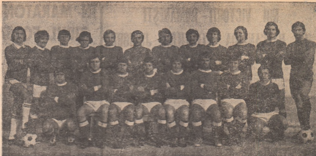
Lotul de jucători care a edus, pentru a doua oară, orașul Rm. Vilcea în prima divizie