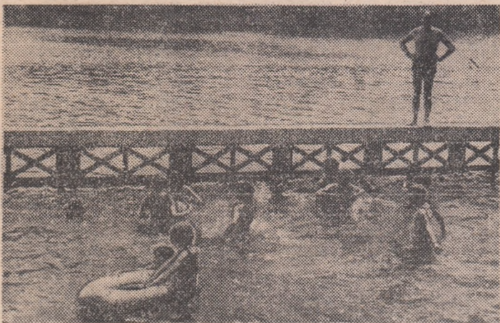
La malul lacului Herăstrău, „farc“ pentru micii inotători