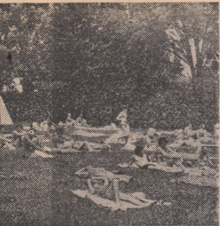
Un decor natural splendid la strandul

liber? au ei la dispoziție. Știi că mai la cit se ridică zilnic stricăciunile bazei? În medie pînă la 300 lei... După un calcul la îndemina oricui, se poate constata că este, într-adevăr, cam mult, dacă ne gîndim la o întreagă vară... (Radu TIMOFTE).