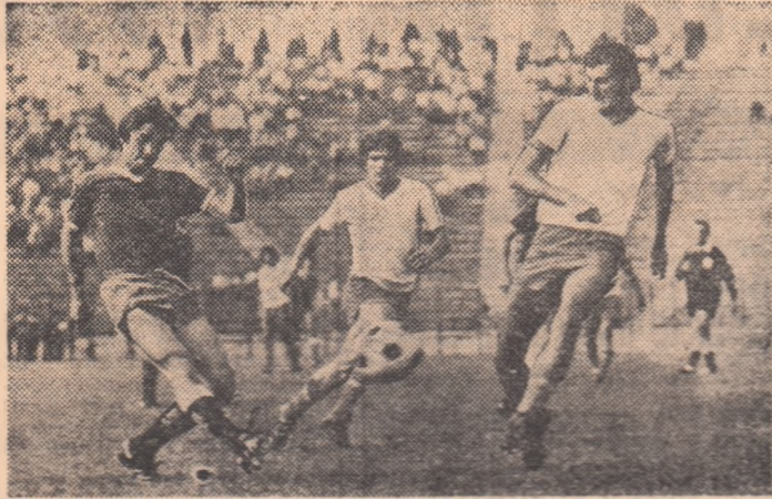
Încă un atac al tinerilor jucători feroviar în fața porții echipei Progresul-Vulcan.