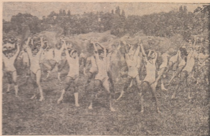
Secvență din repriza de gimnastică ritmică a pionierilor din sectorul 5 al Capitalei

Sportul a constituit o prezență activă în programul acestei mari manifestări a celor mai tineri cetățeni ai patriei